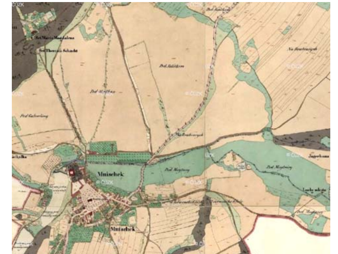
stabilní katastr 1840